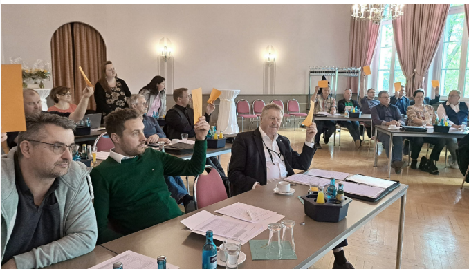
Bild: Abstimmung über den Haushalt des Fachverbandes SHK Sachsen.